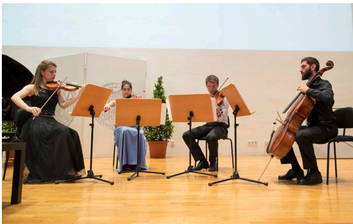
Φωτο: κουαρτέτο εγχόρδων του Ωδείου Mozarteum